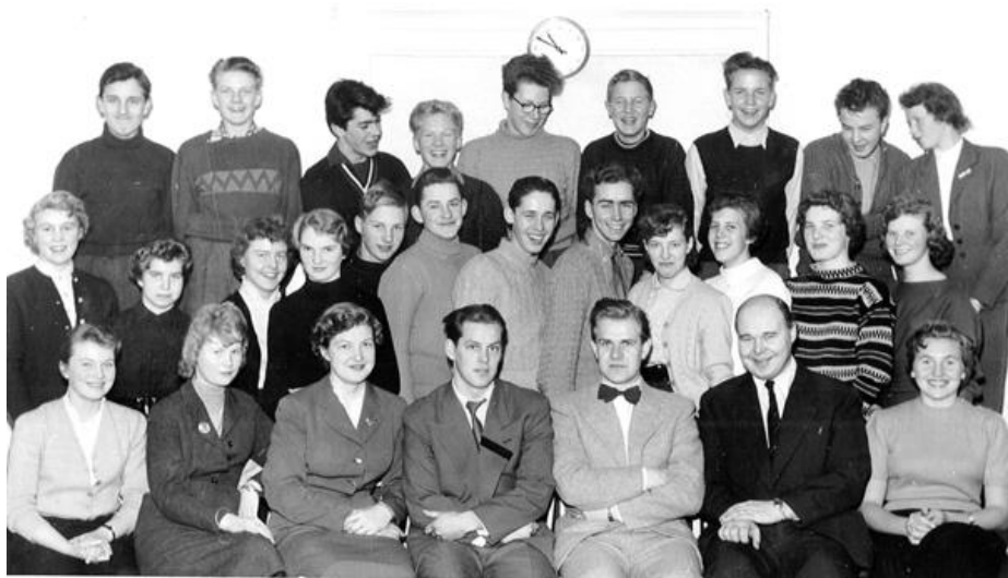
Handelsskolan i Leksand 1955

Dåtidens arbetsförmedlare (år 1955) kunde utan krångel ordna det mesta på bästa sätt. "Tänk om det kunde vara lika enkelt idag!" Jag är evigt tacksam för den hjälp jag fick, som kom att förändra framtiden för mig!