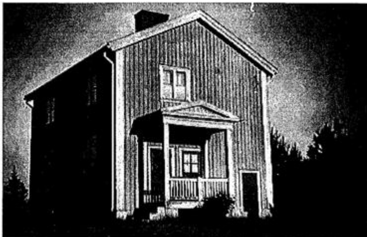
Skolan i Kronvike

Föddes den 6 mars 1934 i ett kronotorp i byn Kronvike, som ligger mitt emellan Hoting och Dorotea i nordvästra Ångermanland intill Lappland. Närmaste affär fanns i byn Rörström, 6 km från Kronvike. Byn hade en telefon hos en av byborna samt en 6-årig B-skola. Min klass utgjorde de första eleverna som fick gå 7:e klass i Hoting och dit fick åka taxi till skolan. Skolbespisning infördes hos grannfamiljen till skolan år 1948. Byn bestod av 14 grannar och antalet skolbarn var som mest tjugo stycken. 1950 påbörjade jag 1:årig Husmodersskola i Hoting, som följdes av arbete som kocka i 4 månader vintern 1951.